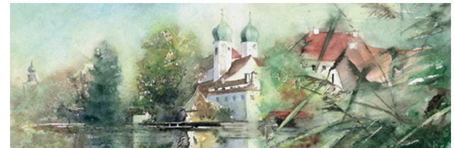
Bildnachweis: Aquarell (auch Titelbild) Hans Torwesten, Kienberg www.atelier-torwesten.de